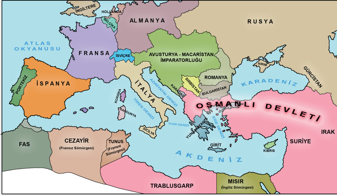
XX. Yüzyıl Başlarında Avrupa ve Osmanlı Devleti

Haritaya bakılarak aşağıdaki yargılardan hangisine ulaşamaz?