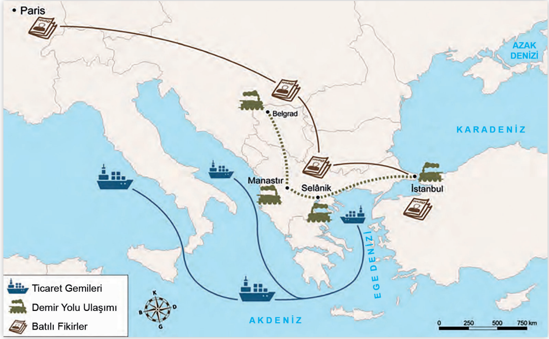
Selânik Şehri'nin Coğrafi Konumu

Haritadan hareketle Selânik şehri ile ilgili;