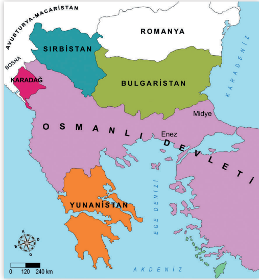
I. Balkan Savaşı Öncesinde Balkanlar