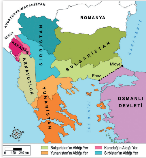
I. Balkan Savaşı Sonrasında Balkanlar

Haritalarda verilen bilgilerden hareketle I. Balkan Savaşı'nın sonuçları ile ilgili aşağıdaki yorulardan hangisi yapılamaz ?